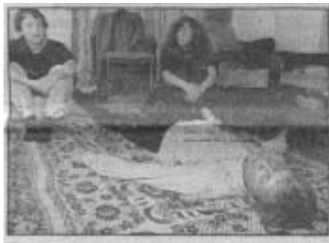
Так меня подвели к черте между жизнью и смертью

— А вы не торопитесь. Все там будем... — предвкушающе улыбнулся Баскаков и предложил: Ложитесь на пол, пожалуйста.